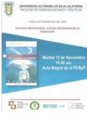
Presentación del libro Estudios fronterizos: Nuevos escenarios de la migración. Organizada por CA Estudios Sociales. Noviembre de 2016.