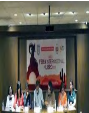
Presentación de libros en la FIL UABC 2017, por el CA Estudios Sociales