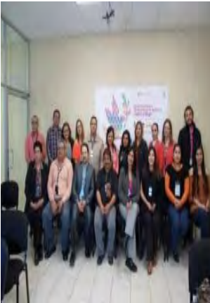
Presentación del libro Los estudios de género en el norte de México. En las fronteras de la violencia. Organizada por CA Estudios Sociales. Noviembre de 2016.