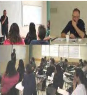
Curso-Seminario Subjetividad y poder en el pensamiento contemporáneo. Autores, debates y perspectivas. Organizado por el CA Sociedad y Territorio. Octubre de 2017.