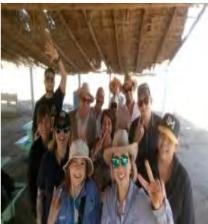
Curso de actualización organizado por la Coordinación del Programa de Maestría y Doctorado en Planeación y Desarrollo Sustentable. Octubre de 2017.