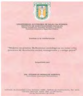
Conferencia Mujeres en prisión: Reflexiones sociológicas en torno a los procesos de desviación social. Organizada por CA Estudios Sociales y Jurídicos, Derechos Humanos y Seguridad Pública. Noviembre 2016.