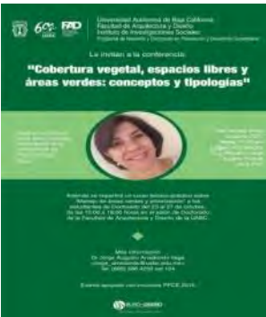
Conferencia Cobertura vegetal, espacio libre y áreas verdes: conceptos y tipologías. Organizado por la Coordinación del Programa de Maestría y Doctorado en Planeación y Desarrollo Sustentable. Octubre de 2017.