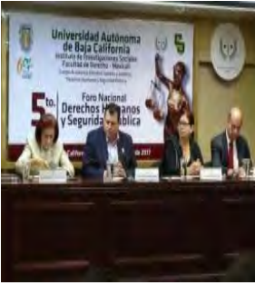
5to Foro Nacional Derechos Humanos y Seguridad Pública. Organizado por el CA Estudios Sociales y Jurídicos, Derechos Humanos y Seguridad Pública. Octubre de 2017.