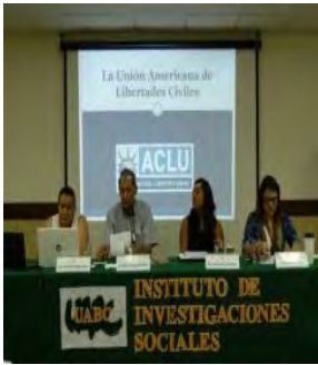
VII Conferencia Binacional Migración/Inmigración: Escenarios de la migración en la era de Trump. Organizadas por el CA Estudios Sociales, Octubre de 2017.