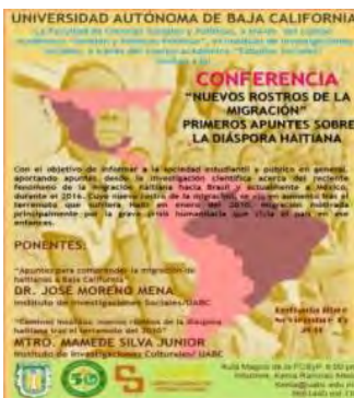
Conferencia Nuevos rostros de la migración. Primeros apuntes sobre la diáspora haitiana. Organizada por CA Estudios Sociales y CA Gestión y Políticas Públicas (FCSyP). Noviembre 2016.