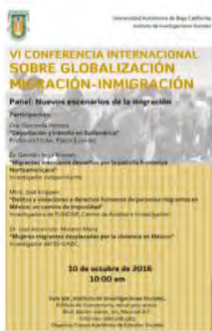
Tabla 26. Eventos académicos organizados por el IIS